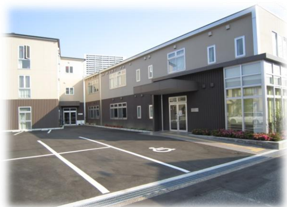
～生活支援センター雪見橋～

平成22年に建てられた新しい事業所です。毎月一回、協力農家の無農薬野菜を敷地内で販売しご近所の皆さんに好評です♪