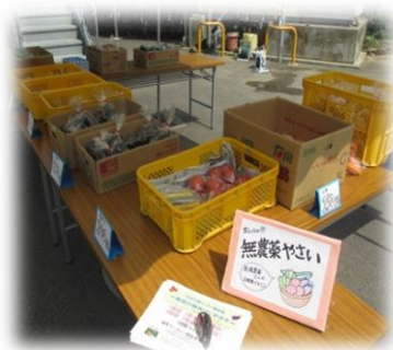
～野菜市はご近所の皆さんに重宝されています～