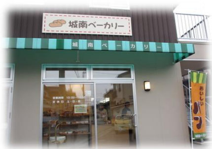
～敷地内のベーカリー～