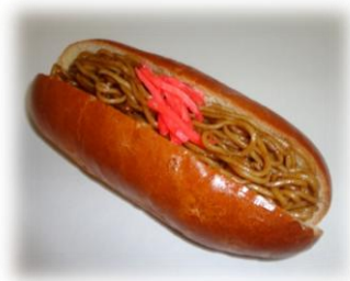
～職員一押し！焼きそばパン～