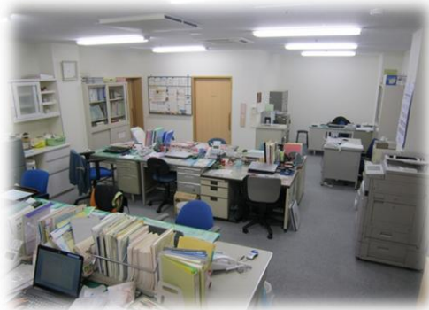
～職員室はワンフロアに各事業ごとに分かれています～